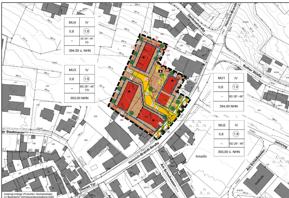
Auszug aus dem Planblatt des Bebauungsplans „Baugebiet Nr. 29 „An den Feldwiesen“

Das Verfahren zur Aufstellung des Bebauungsplans erfolgt als „Bebauungsplan der Innenentwicklung“ gem. § 13a BauGB. Die notwendigen Kriterien hierfür sind erfüllt. Mit dem Bebauungsplan sollen Maßnahmen zur Nachnutzung und Nachverdichtung verfolgt werden. Die festzusetzende Grundfläche liegt unter 20.000 m 2 . Die weiteren in § 13a benannten Kriterien sind ebenfalls erfüllt. Das beschleunigte Verfahren erfolgt gem. den Maßgaben des § 13a BauGB i.V.m. § 13 BauGB.