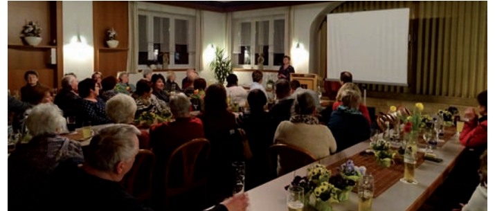
Text: Amodeo

Der Termin dafür wird rechtzeitig bekannt gegeben.