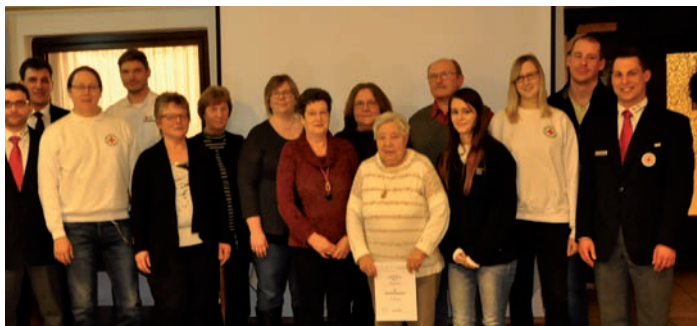
Allen Jubilaren einen herzlichen Glückwunsch.