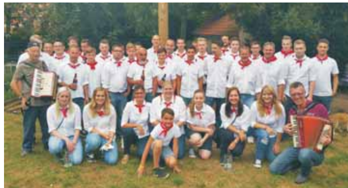
TSV Windsbach 1892 e.V.

Am Sonntag klingt die Kirchweih mit einem Festgottesdienst in der St. Nikolauskirche um 09:45 Uhr aus.