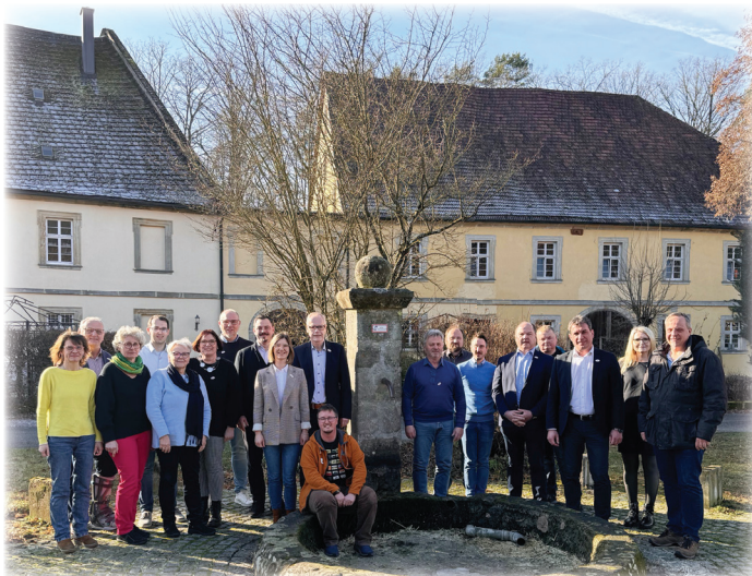
Teilnehmer:innen der Evaluierung: Bürgermeister:innen, Mitarbeiter:innen der Verwaltungen und das Umsetzungsmanagement.

So betonte der Vorsitzende der Kommunalen Allianz Kernfranken: „Es mangelt nicht an zukünftigen Herausforderungen, aber gemeinsam werden wir diese leichter bewältigen können. Der Austausch zwischen den Kommunen bietet einen großen Mehrwert für alle und so wollen wir auch die nächsten Jahre gemeinsam Projekte angehen“.