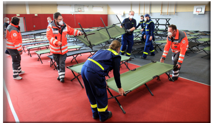
Zahlreiche Helfer des Roten Kreuzes hielten sich am Sonntag in Herrieden für die Versorgung von geflüchteten Menschen bereit.

Das Landratsamt Ansbach nahm die auf maximal 230 Plätze ausgelegte Notunterkunft in Herrieden am Freitag, 18. März 2022 in Betrieb. Sie dient als erste Anlaufstelle, um möglichst viele geflüchtete Menschen in sehr kurzer Zeit unterbringen zu können. Genauso wie in der zentralen Erstanlaufstelle in der ehemaligen Jugendherberge in Feuchtwangen ist dort eine dauerhafte Unterbringung ist nicht vorgesehen. Ziel ist viel mehr, möglichst bald geeignete Wohnungen für die Geflüchteten zu finden. Dazu liegen dem Landratsamt Ansbach derzeit zahlreiche Wohnungsangebote vor, die die derzeit ausgewertet und schnellstmöglich angemietet werden. Bislang wurden in den Städten und Gemeinden des Landkreises Ansbach bereits über 900 Personen angemeldet. Es wird davon ausgegangen, dass sich eine weitaus höhere Zahl an geflüchteten Menschen bereits in der Region befindet und noch in den nächsten Tagen melden wird. Zahlreiche Helfer des Roten Kreuzes hielten sich am Sonntag in Herrieden für die Versorgung von geflüchteten Menschen bereit.