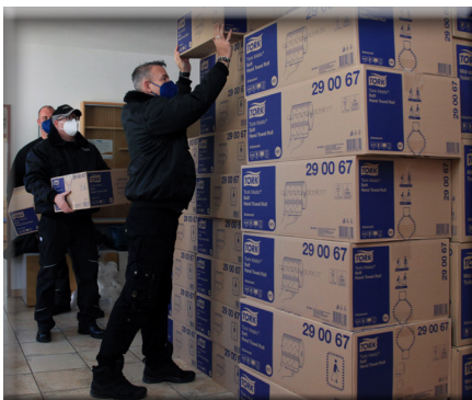
Mitarbeiter der beauftragten Sicherheitsfirma tragen Vorräte in die ehemalige Jugendherberge in Feuchtwangen. Das Landratsamt Ansbach hat hier eine zentrale Erstanlaufstelle für geflüchtete Menschen aus der Ukraine eingerichtet.

Um den geflüchteten Menschen aus der Ukraine schnell Hilfe anbieten zu können, bittet das Landratsamt Ansbach die Bürgerinnen und Bürger, auch weiterhin leerstehenden Wohnraum im Landkreis zu melden – auch wenn dieser nur kurzzeitig angemietet werden kann. Bei Fragen steht die Sozialhilfverwaltung im Landratsamt Ansbach unter der Nummer 0981/468-5151 zur Verfügung. Freie Wohnungen können auch per Mail an wohnungsangebot@landratsamt-ansbach.de gemeldet werden.