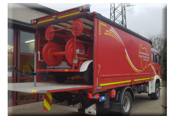
Bildunterschrift: Die Unterstützungsgruppe Örtliche Einsatzleitung (UG-ÖEL) des Landkreises Ansbach sammelte Ausrüstungsgegenstände für die Feuerwehrkameraden in der Ukraine ein.

Feuerwehren aus dem Landkreis Ansbach haben sich an einer Spendenaktion des Landesfeuerwehrverbandes Bayern zugunsten der Feuerwehren in der Ukraine beteiligt. Helme, Schläuche, Schneidgerät, Einsatzkleidung und andere ausgesonderte, aber noch einsetzbare Ausrüstungsgegenstände wurden zusammengetragen und von der Unterstützungsgruppe Örtliche Einsatzleitung (UG-ÖEL) des Landkreises Ansbach zum Sammelpunkt für Nordbayern an das Feuerwehrgerätehaus in Lauf an der Pegnitz transportiert.