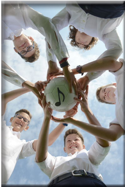
Singen verbindet – die in Windsbach geknüpften Freundschaften halten oft ein Leben lang.

Das evangelische Sängerteam begleitet und fördert die 130 Jungen zwischen 9 und 19 Jahren mit einem ganzheitlichen pädagogischen Konzept. Sie leben mit Gleichaltrigen in ihrer Gruppe, haben einen strukturierten Tagesablauf mit festen Lern- und Betreuungszeiten. Neben der Gesangs- und Musikausbildung finden sich auf dem Campus viele Möglichkeiten der aktiven Freizeitgestaltung, ob auf dem Fußballplatz, beim Basket- oder Beachvolleyball, in der eigenen Holzwerkstatt oder in der Töpferei.