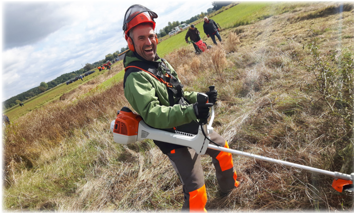
Der Lehrgang zum Geprüften Natur- und Landschaftspfleger/zur Geprüften Natur- und Landschaftspflegerin startet im September 2022.

Nähere Informationen zum Lehrgang und zur Anmeldung unter: www.reg-ofr.de/gnl