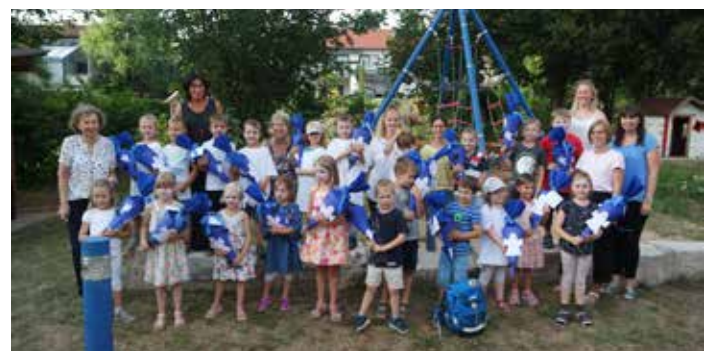
Bild der Vorschulkinder und Väter beim Grillen

Das traditionelle Suchen des Schultütenbaumes im Garten und das letzte Gruppenfoto von allen Vorschulkindern bildeten den Abschluss. Viel Spaß und viel Freude beim Lernen in der Schule wünscht euch das KiwiTeam!