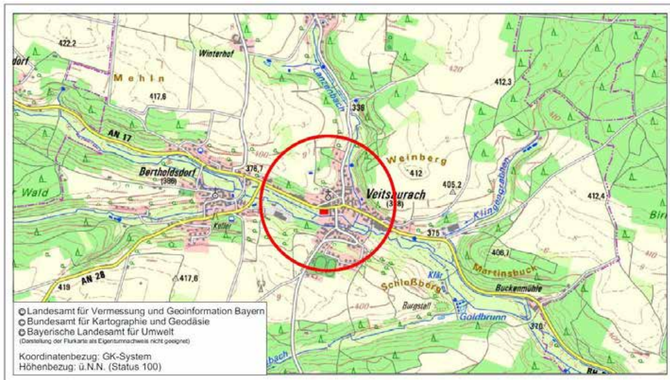
Übersichtskarte mit Kennzeichnung des Planungsgebietes

Der Bebauungsplan mit integriertem Grünordnungsplan Nr. 3 „Spiel- und Dorfplatz“ in Veitsaurach bestehend aus Planblatt, Satzung und Begründung sowie den weiteren Anlagen ist gem. § 10a Abs. 2 BauGB in das Internet unter www.windsbach.de → Rubrik Leben und Wohnen → Bauen → Bebauungspläne eingestellt und kann dort ebenfalls eingesehen werden.