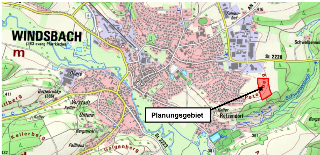
Rot flächig markiert Lage des Planungsgebiets, © Kartendarstellung: Bayerische Vermessungsverwaltung

Der Beschluss zur Aufstellung des Bebauungsplans „Baugebiet Badstraße – Bauabschnitt 3“ mit integriertem Grünordnungsplan wird hiermit gem. § 2 Abs. 1 Satz 2 BauGB bekannt gemacht.